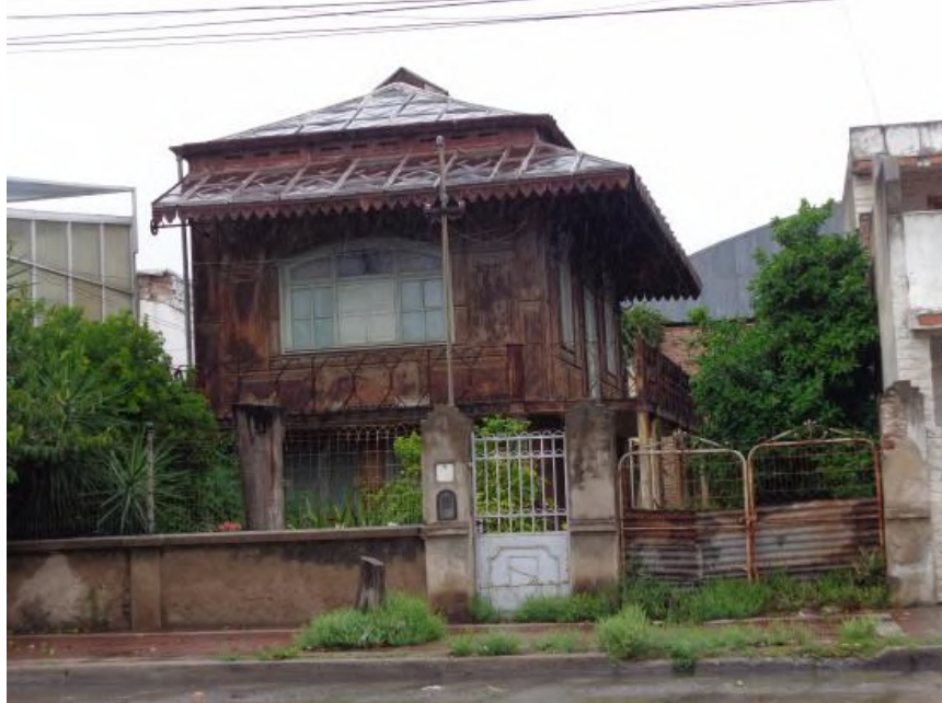
Casa Eiffel en Córdoba